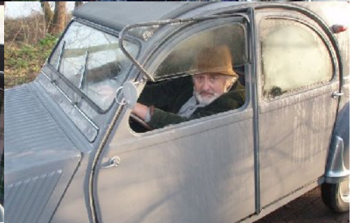
Silence Moteur Action