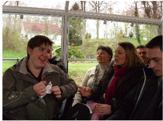
Mais de quoi peuvent-elles parler toutes les 2.