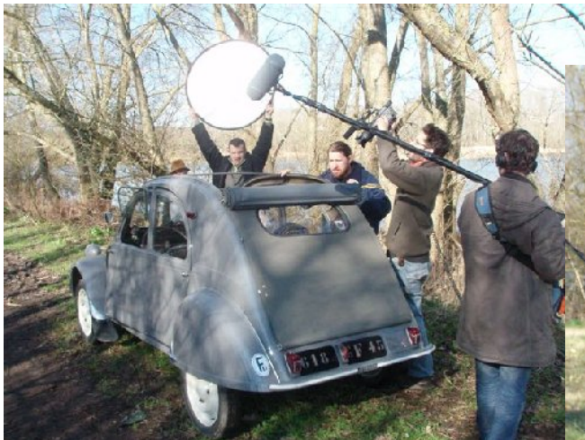
Les acteurs se la jouent