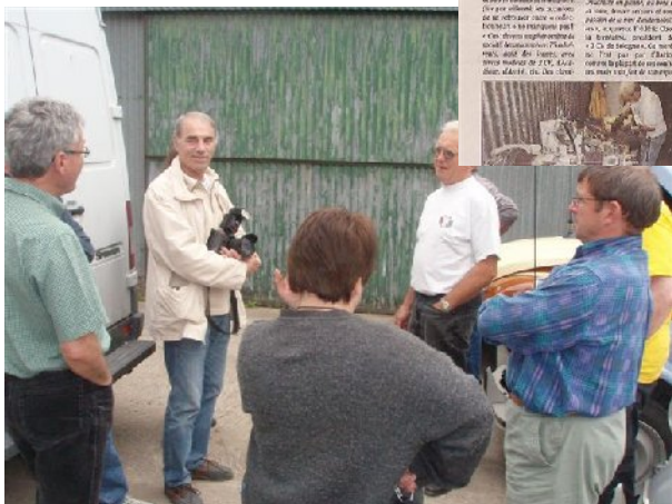
Parfois on jardine ....