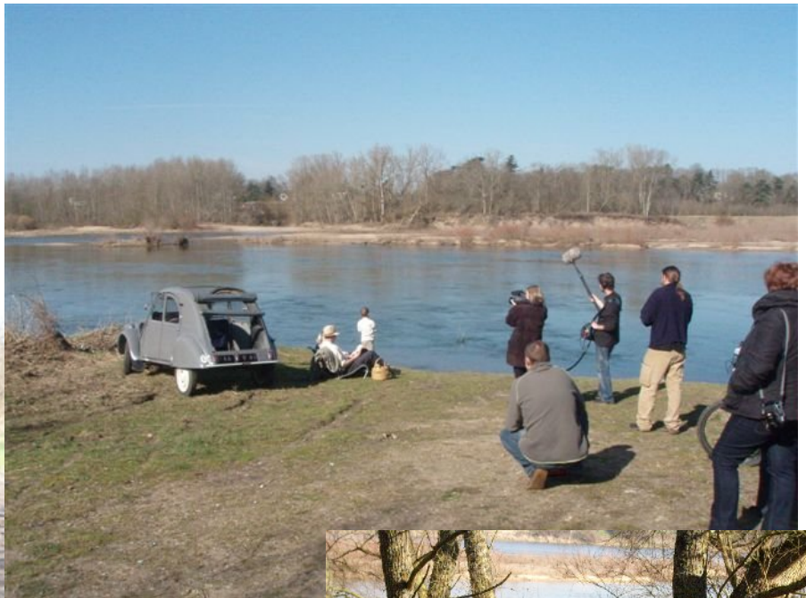
En bord de Loire