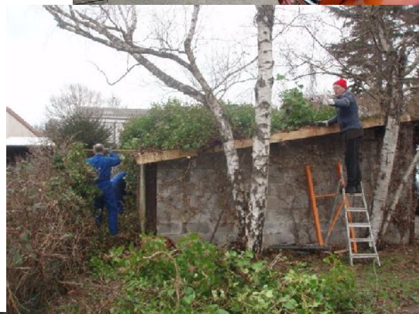
Mais il faut penser à arroser.....