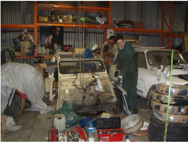
Cours particuliers pour certains