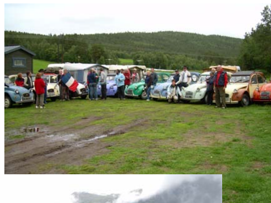
Le paysage est magnifique