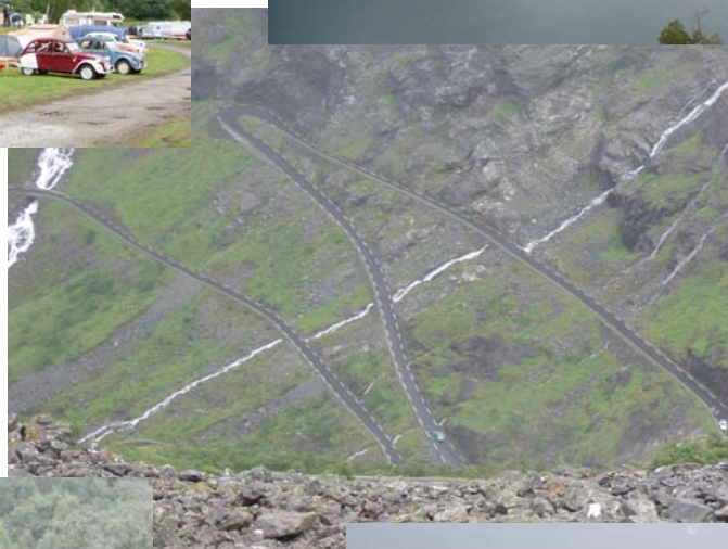
La route grimpe