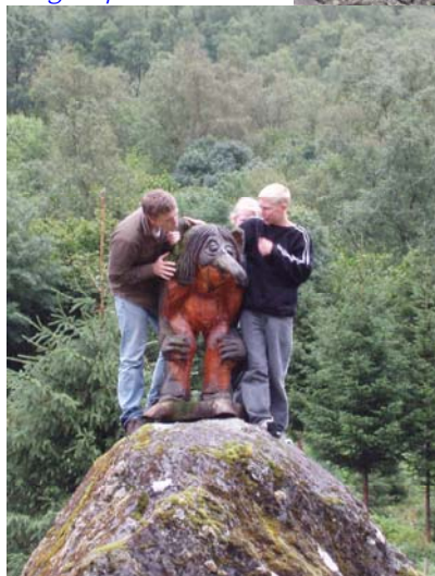
Un groupe de Trolls