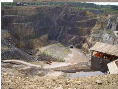
La mine de Faloun