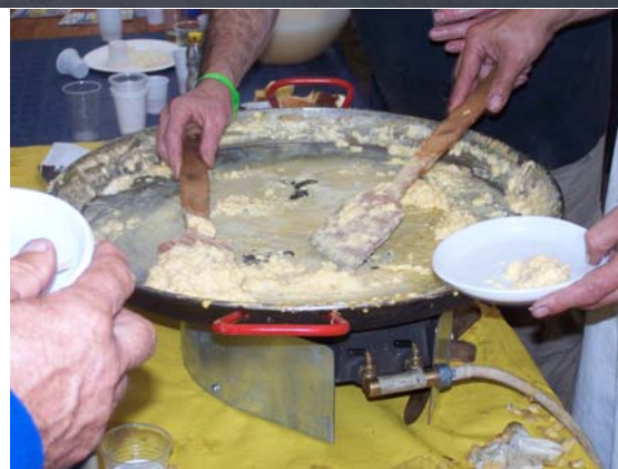
Dégustations sous le chapiteau