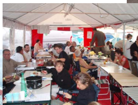
Nous sommes nombreux à nous tenir au chaud et à l'abri sous les barnums