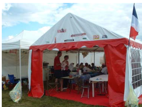
Camping typique à la Française !