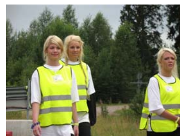
Comité d'accueil suédoise